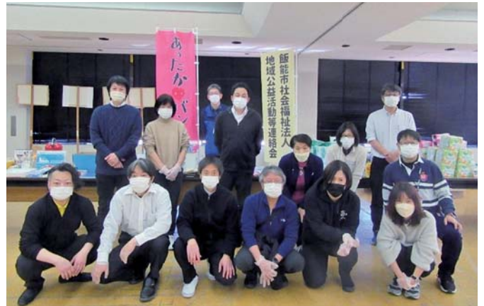
「市内9つの社会福祉法人のメンバーが集合！」

新型コロナウイルス感染拡大の影響で失業や収入減により生活にお困りの世帯が増える中、その方達への生活支援を目的に「あったか ハート バンク飯能」を令和4年3月6日(日)に開催しました。お渡しする食品や日用品は各法人の役職員に募り、当日は30世帯の方のお手元に届ける事ができました。ご協力いただいたみなさま、ありがとうございました。