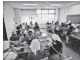
会食の様子（過去開催時）