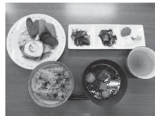
手作りの料理（過去開催時）