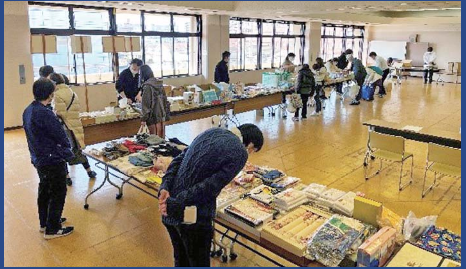
「初めての取組にも関わらず、当日は沢山の方にお越しいただきました」