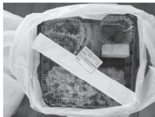
活動最終日のお弁当