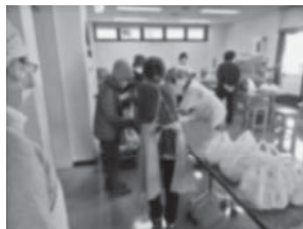
お弁当と鉢花をお渡ししている様子

39年もの長い間、あたたかくて楽しい食事会を開催していただき、本当にありがとうございました！